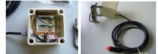
車両(トラック)用に加工したTAGの例