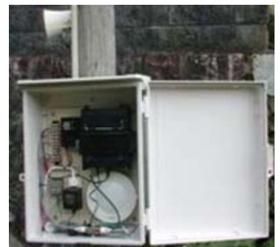
アラームも、消音/小/大と3段階切替に