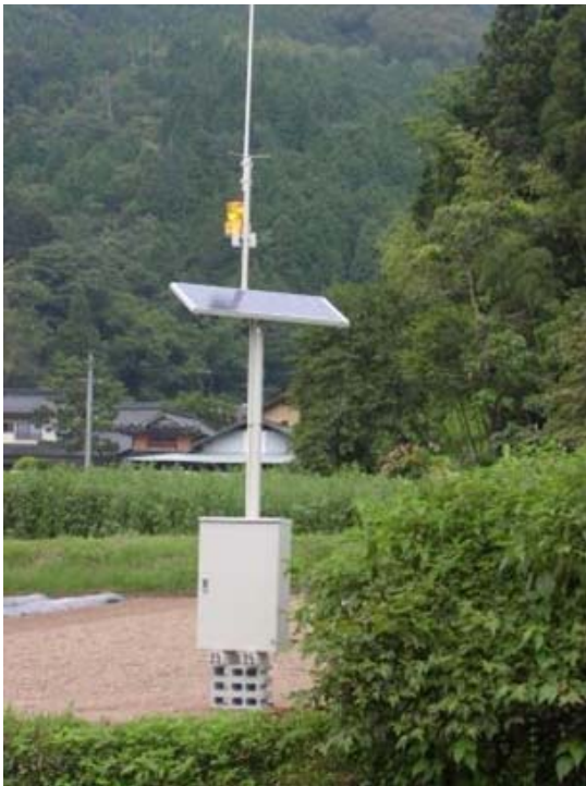
独立電源型 特注地上高4m柱+1.8m