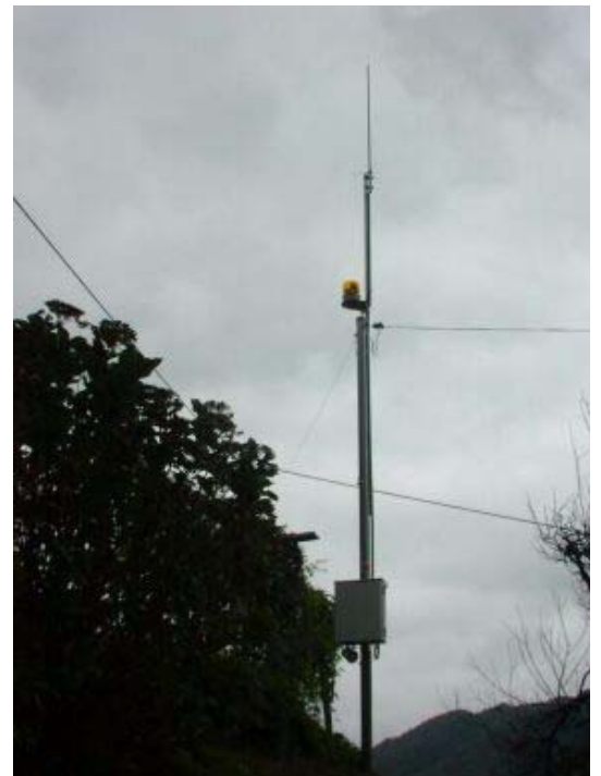
商用電源型 89φ地上高4m柱+3.5m