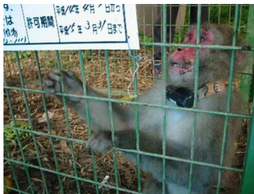
捕獲され、発信器を取り付けられた猿 台風目になってくれます