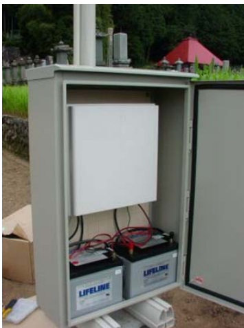
耐用年数10年のバッテリーを搭載